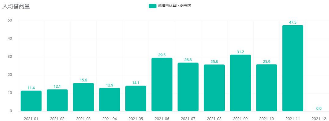
图 3 2021 年人均借阅量统计趋势图

对 2021 年环翠区图书馆综合借还统计趋势图进行分析，从图中可以看到，总流通册次最高的月份是 12 月份，人均借阅 47.5 册次。