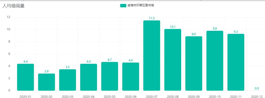
图 3 2020 年人均借阅量统计趋势图

对 2020 年环翠区图书馆综合借还统计趋势图进行分析，从图中可以看到，总流通册次最高的月份是七月份，人均借阅 11.5 册次。此后，由于服务内容和水平不断提高，人均借阅量始终维持在较高水平。